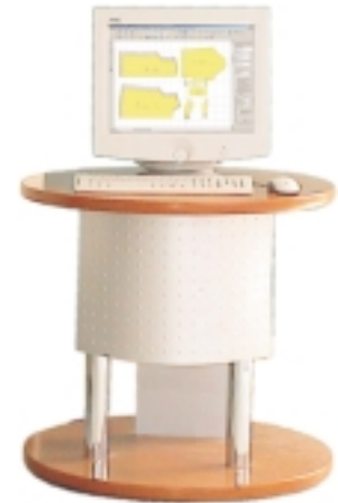
Gemini CAD Creative Working Station *