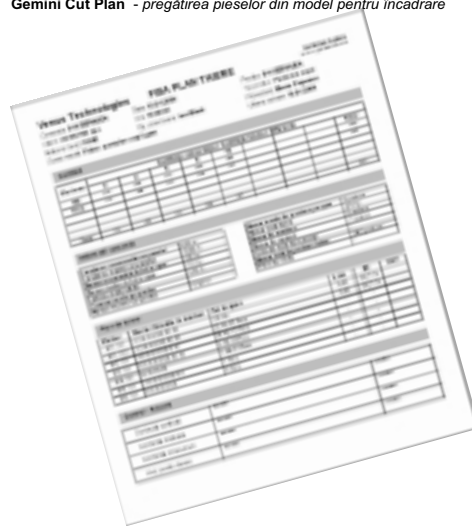
Gemini Cut Plan - fișa de sinteză a planului de tăiere

Gemini Cut Plan efectuează automat toate calculele privind consumurile, eficiența, cantitățile tăiate și diferențele apărute pe culori și mărimi, și le centralizează pentru a fi tipărite în Fișa planului de tăiere , un document extrem de util pentru gestionarea comenzilor.