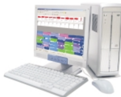
Gemini Nesting Station - un singur computer poate realiza complet automat incadrarile pentru mai multi operatori intr-o intreprindere

Gemini Nest Expert poate trimite incadrarile optimizate direct catre plotter sau masina de taiat automata, sau poate exporta rezultatul in format DXF pentru a fi preluat in alte aplicatii CAD.